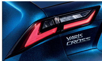
ไฟท้ายแบบ Full LED