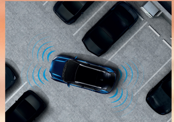
สัญญาณเตือนกะระยะด้านหน้า 2 ตำแหน่ง และด้านหลัง 2 ตำแหน่ง