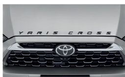
โลโก้ YARIS CROSS สีดำงาน/ ตัวกระฉับหน้าโครเมียม