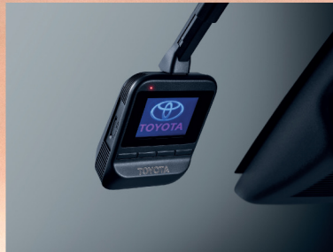
กล้องบันทึกภาพหน้ารถ