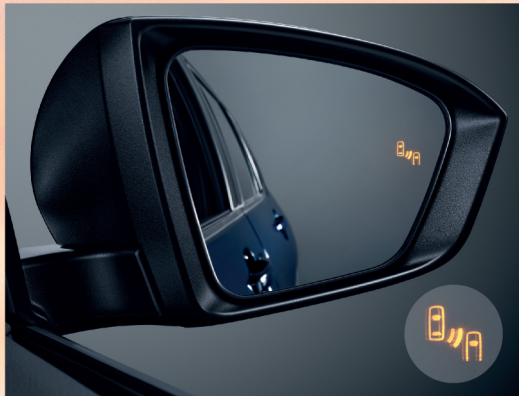
ระบบช่วยเตือนมุมอับสายตาที่กระจกมองข้าง BSM (Blind Spot Monitor)