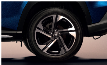
ล้ออัลลอยปิดเงาสีทูโทน 18 นิ้ว