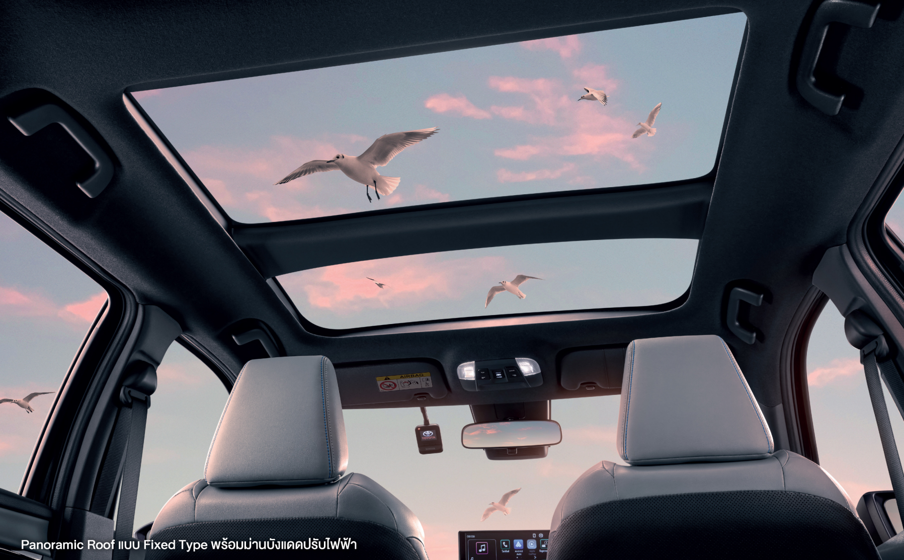
Panoramic Roof แบบ Fixed Type พร้อมม่านบังแดดปรับไฟฟ้า