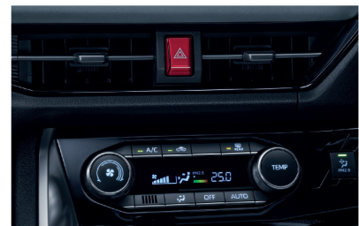
ระบบปรับอากาศแบบอัตโนมัติ พร้อมระบบกรองฝุ่น PM 2.5