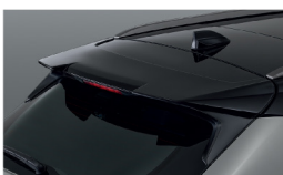
สปอยเลอร์หลังคา