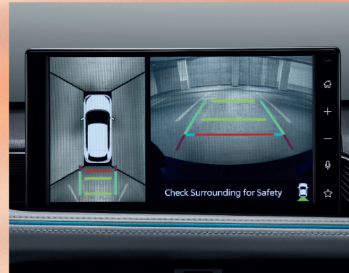
กล้องมองรอบคัน PVM (Panoramic View Monitor)