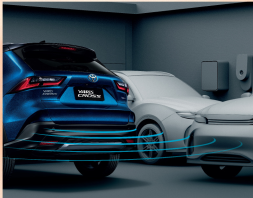
ระบบช่วยเตือนขณะถอยรถ RCTA (Rear Cross-Traffic Alert)