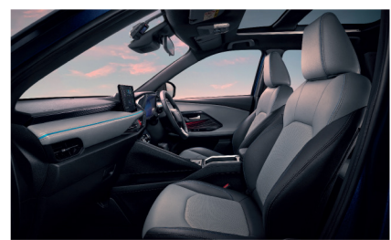
เบาะหุ้มหนังสังเคราะห์ พร้อมเทคโนโลยี QUOLE MODURE® ที่เบาะคู่หน้า ลดการสะสมความร้อนบนผิวสัมผัส