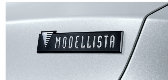
สัญลักษณ์ MODELLISTA ท้ายรถ