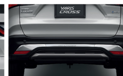
คิ้วตกแต่งกันชนหลังโครเมียม

อุปกรณ์ตกแต่งแท้โตโยต้ารับประกันสูงสุด 3 ปี หรือ 100,000 กม. (ตามรุ่นรถยนต์ที่บริษัทฯ กำหนด โปรดศึกษารายละเอียดจากคู่มือการรับประกันคุณภาพ และคู่มือการใช้งานรถยนต์)