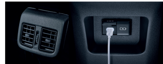
ช่องปรับอากาศตอนหลัง พร้อมช่องต่อ USB Type-C 2 ตำแหน่ง