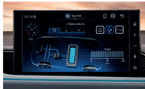
หน้าจอแสดง Energy Flow ของระบบไฮบริด