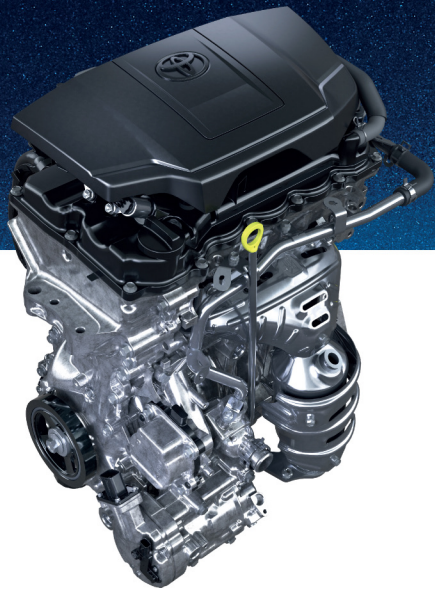
เครื่องยนต์ 2NR-VEX 4 สูบ DOHC 16 วาล์ว แบบ Dual VVT-i