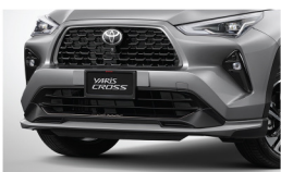
สเกิร์ตกันชนหน้า