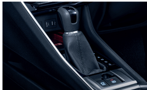
เกียร์อัตโนมัติ E-CVT