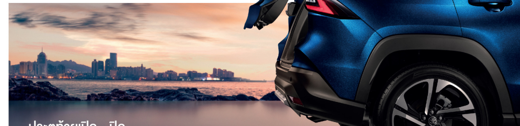
ประตูท้ายเปิด - ปิด ด้วยระบบไฟฟ้า พร้อมระบบ Kick-Activated