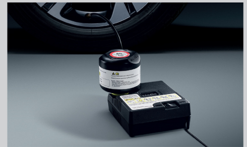
ชุดซ่อมยางฉุกเฉิน