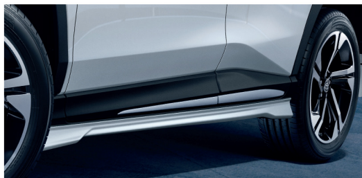
ชุดสเกิร์ตข้าง