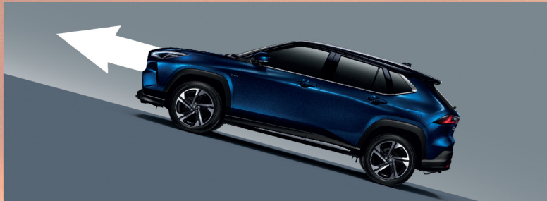
ระบบช่วยออกตัวบนทางลาดชัน HAC (Hill-start Assist Control)