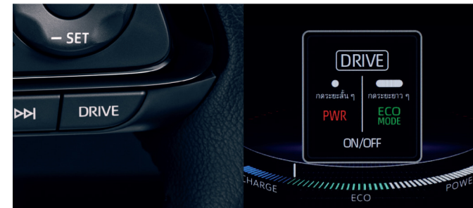
สวิตช์ปรับโหมดการขับเคลื่อนพวงมาลัย ECO / NORMAL / POWER