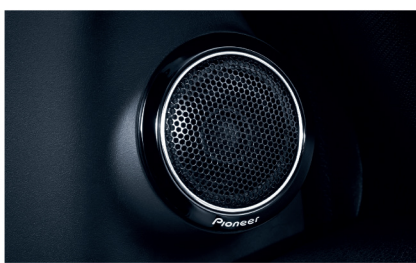
ลำโพง Pioneer ระดับพรีเมียม 6 ตำแหน่ง