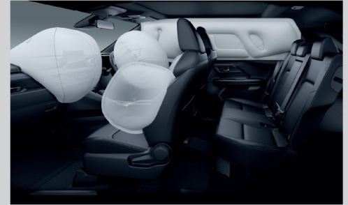
ถุงลมเสริมความปลอดภัย SRS 6 ตำแหน่ง คู่หน้า / ด้านข้าง / ม่านด้านข้าง