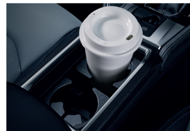
ที่วางแก้วน้ำ 2 ตำแหน่ง บริเวณห้องโดยสารตอนหน้า