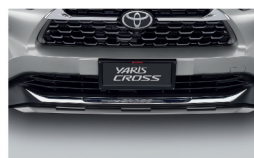
คิ้วตกแต่งกันชนหน้าโครเมียม