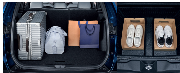
พื้นที่เก็บสัมภาระท้ายรถ พร้อมช่องเก็บของนอกประสค์