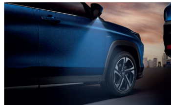
ไฟส่องสว่างบริเวณประตูคู่หน้า Welcome Lamp