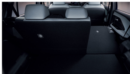
เบาะนั่งด้านหลังแยกพับได้ 60:40