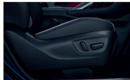
เบาะที่นั่งคนขับปรับไฟฟ้า 8 ทิศทาง