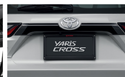
คิ้วตกแต่งประตูท้าย