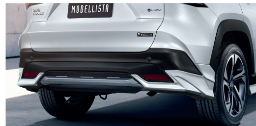
สเกิร์ตกันชนหลัง