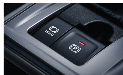
ระบบเบรกมือไฟฟ้า EPB และระบบหน่วงเบรกอัตโนมัติ ABH