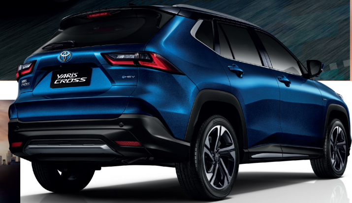
หลังคาสีดำ พร้อมราวหลังคาสีเงินเมทัลลิก เสาอากาศแบบคริสตัลและ-สปอยเลอร์หลัง