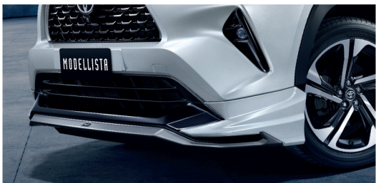
สเกิร์ตกันชนหน้า

ชุดอุปกรณ์ตกแต่งเพิ่มเติม MODELLISTA ประกอบไปด้วย สเกิร์ตกันชนหน้า ชุดสเกิร์ตข้าง สเกิร์ตกันชนหลัง และสัญลักษณ์ MODELLISTA ท้ายรถ มีเฉพาะสี PLATINUM WHITE PEARL, METAL STREAM METALLIC และ URBAN METAL ผลิตและรับประกันโดย บริษัท ทีซีดี เอชซี จำกัด เป็นระยะเวลาสูงสุด 3 ปี หรือ 100,000 กม. แล้วแต่อย่างใดอย่างหนึ่งถึงก่อนตามเงื่อนไขที่กำหนด (ต้องติดตั้งโดยผู้แทนจำหน่ายโตโยต้าเท่านั้น) โปรดศึกษารายละเอียดการรับประกันเพิ่มเติมที่ www.toyota.co.th/accessories/warranty