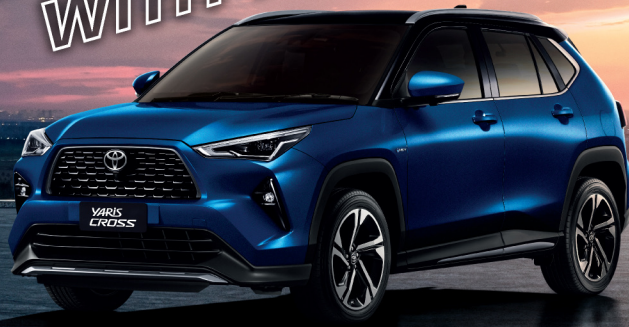
HEV PREMIUM LUXURY