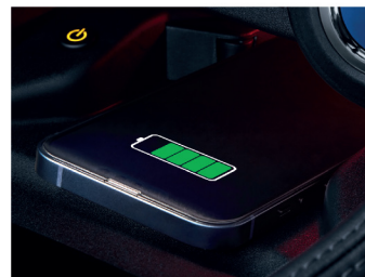
อุปกรณ์ชาร์จไฟแบบไร้สาย (Wireless Charger)