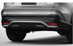
สเกิร์ตกันชนหลัง