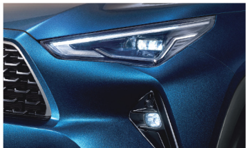
ชุดไฟหน้า พร้อมไฟตัดหมอก แบบ Full LED