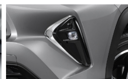
กรอบไฟตัดหมอกโครเมียม