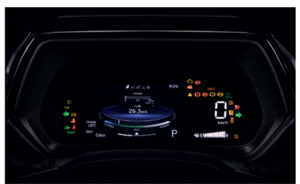
มาตรวัด Digital พร้อมจอแสดงข้อมูลการขับขี่ TFT 7 นิ้ว